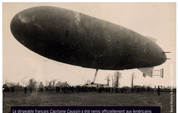
Le dirigeable français Capitaine Caussin a été remis officiellement aux Américains en novembre 1918. On l'aperçoit ici, sur le terrain de l'aérostation de Guipavas