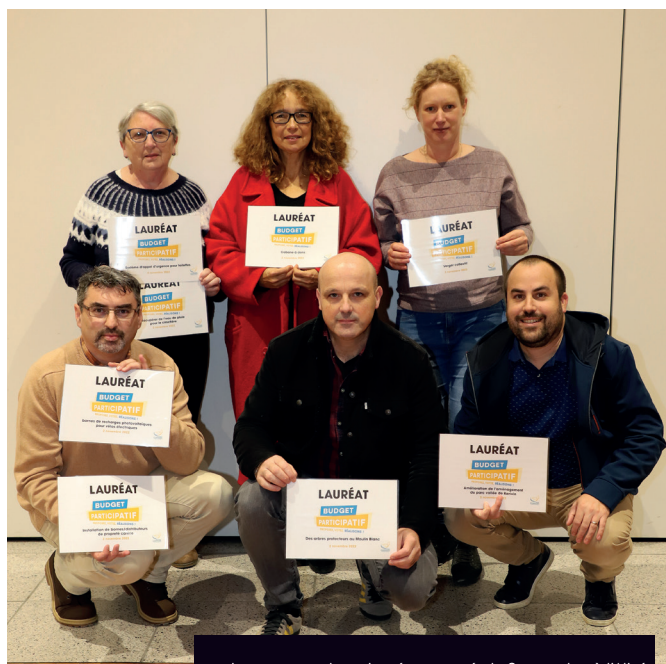
Les porteurs de projet récompensés le 2 novembre à l'Alizé