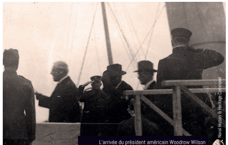
L'arrivée du président américain Woodrow Wilson (2 e à gauche) au port de Brest le 13 décembre 1918