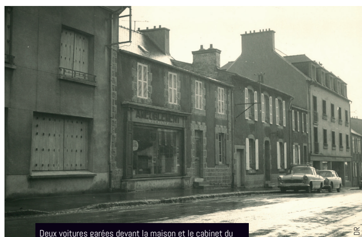
Deux voitures garées devant la maison et le cabinet du docteur Lavenant situés au 15 et 17 rue de Brest